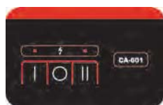
Łatwy w użyciu wodoodporny panel sterujący