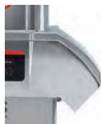
Boczny otwór wylotowy