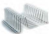
Stojak do tarcz