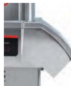
Boczny otwór wylotowy