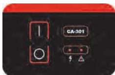
Łatwy w użyciu wodoodporny panel sterujący