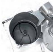
Podajnik do dużych wydajności