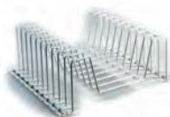
Stojak do tarcz