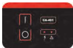
Łatwy w użyciu wodoodporny panel sterujący