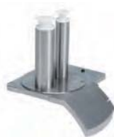
Podajnik rurowy do warzyw długich