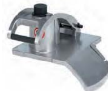
Łatwy demontaż pokrywy z podajnikiem