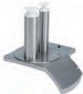
Podajnik rurowy do warzyw długich