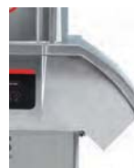
Boczny otwór wylotowy