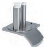
Podajnik rurowy do warzyw długich