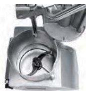
Profilowany dysk ewakuacyjny